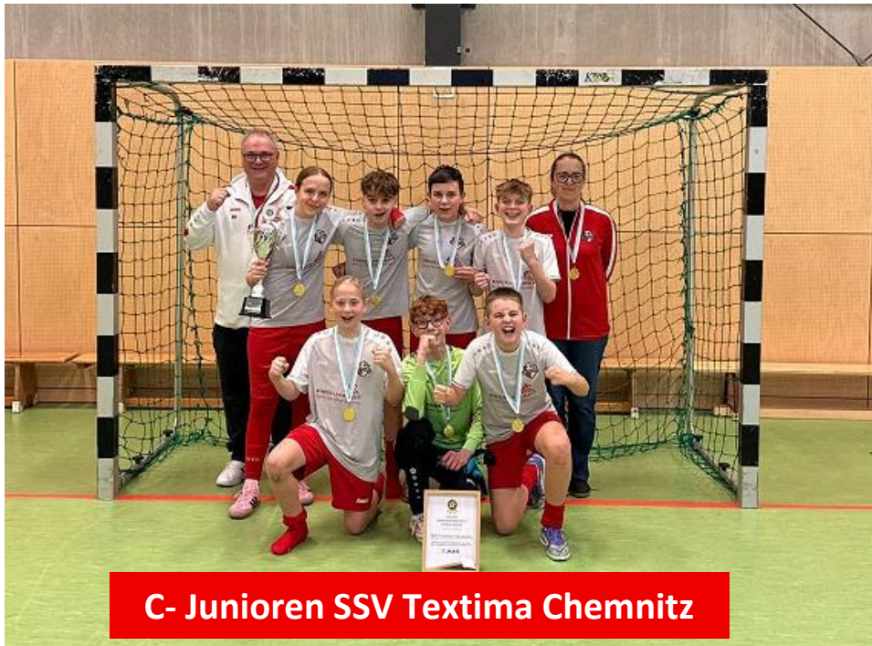
C- Junioren SSV Textima Chemnitz