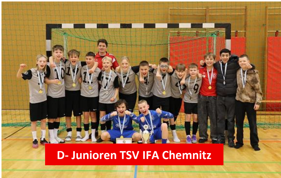
D- Junioren TSV IFA Chemnitz