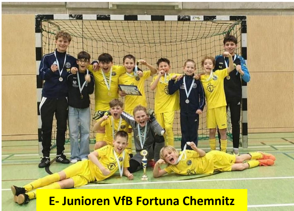
E- Junioren VfB Fortuna Chemnitz