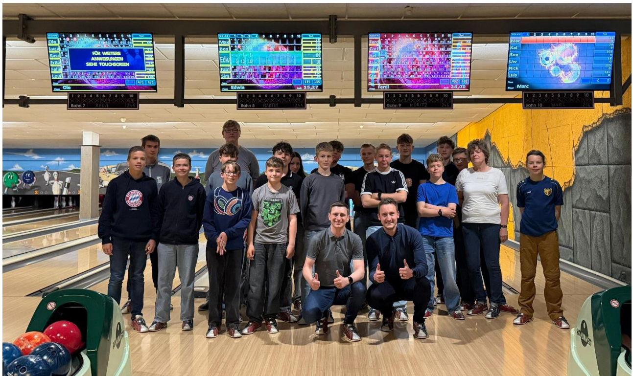
Bericht und Fotos von Steve Schultheiß und Christian Bretschneider

Wir bedanken uns in aller Form beim Kreisverband Fußball Chemnitz e.V. für die Unterstützung unseres Saisonabschlusses und freuen uns auch weiterhin, einen Kreis von über 50 Schiedsrichterinnen und Schiedsrichtern, auf ihrem Weg im Schiedsrichteralltag begleiten zu dürfen.